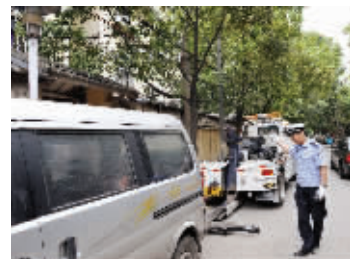
违停清拖现场

昨天,南京交管部门联动整治机动车违停,在宁夏路、马鞍山路,交警五大队短短半小时就清拖了十余辆违停车辆。但在宁夏路,一辆违停的宝马轿车让交警也有些犯难。原来,该车系四驱,加上紧贴路牙,很难清拖。据悉,以后针对违停“钉子户”,除了交警部门处罚外,屡教不改的,公安机关还会上门进行法制教育,造成严重后果的还要被传唤。