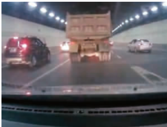
就是这辆嚣张的渣土车(视频截图,请拍摄者来领取稿费)