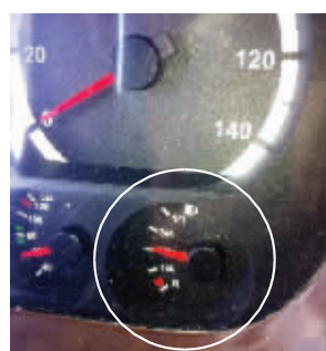
油量表仅这几档显示,太不精确了