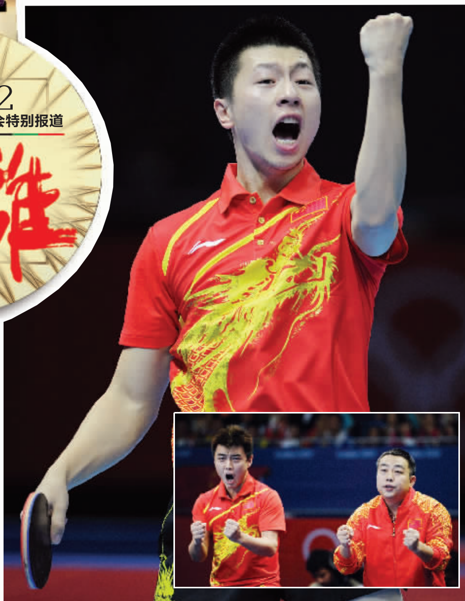
中国队选手马龙在比赛中庆祝得分;小图为主教练刘国梁(右)和王皓为队员加油

“亚当斯在决赛中可能获得主场优势,也许还能得到一些裁判的照顾,但我要打出自己的水平,以实力来赢得裁判对我的评判。” 新华社