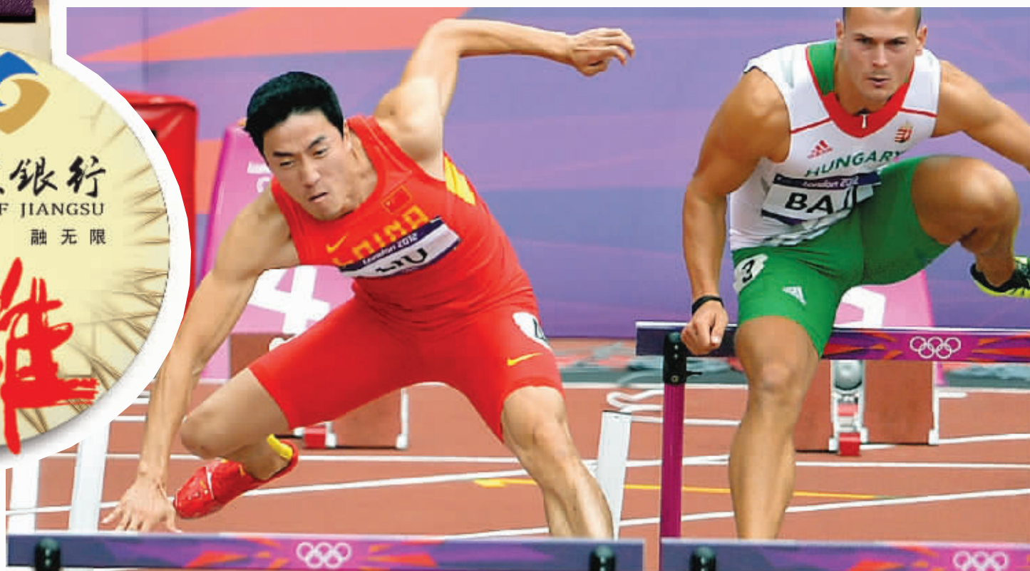
刘翔(左)跨第一个栏时便摔倒了