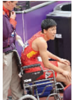
刘翔赛后坐在了轮椅上