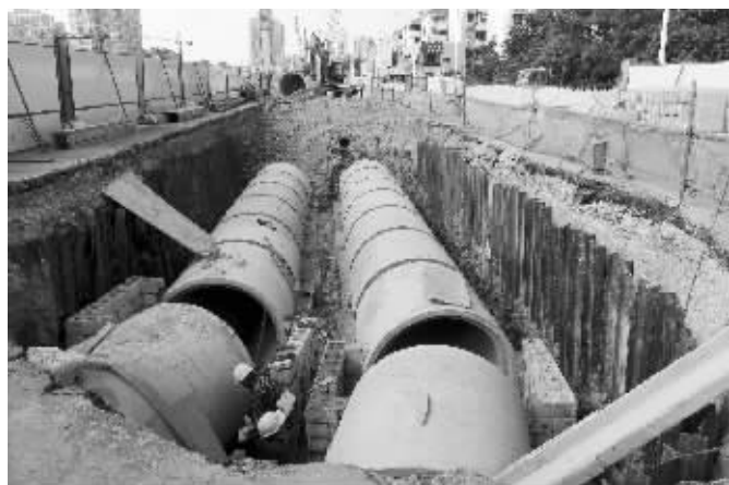
昨天,集庆门附近正在进行管道施工

围挡施工,如太平北路、北京东路、幕府西路等,北京西路、苜蓿园大街等主干道也即将纳入施工计划。“现在除了三中路没有围挡之外,其它的一些主干道多多少少都在动工。”交管专家说。因此,南京的交通状况会受到更大挑战。那么,届时,会不会有一些新的管制措施出台呢?“从目前来看,只能做一些细枝末节的调整。”这位交管专家告诉记者,比如为了方便家住河西的市民能够方便进出主城,会在连接江东路的一些支路设置成单行线,但大的管制措施不会推出。