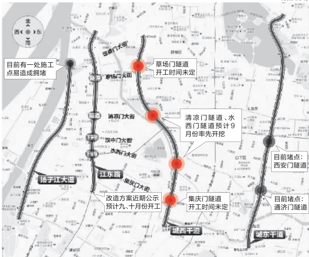
城西干道施工后 南北干道车流量变化