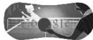
8月2日,乒乓球比赛谷歌涂鸦