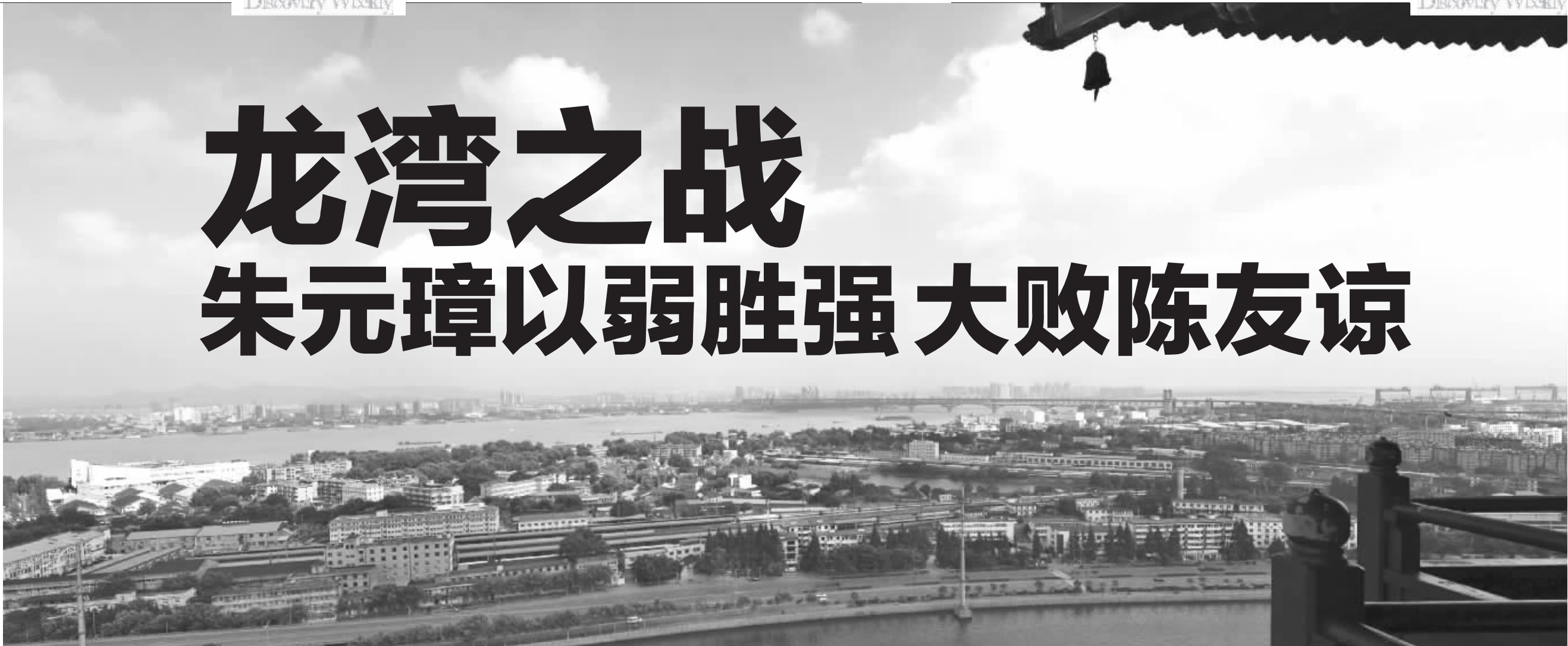
从狮子山上俯拍的下关沿江,公元1360年6月23日至24日,朱元璋就是坐镇狮子山指挥龙湾之战的