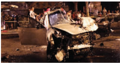
肇事轿车撞得面目全非