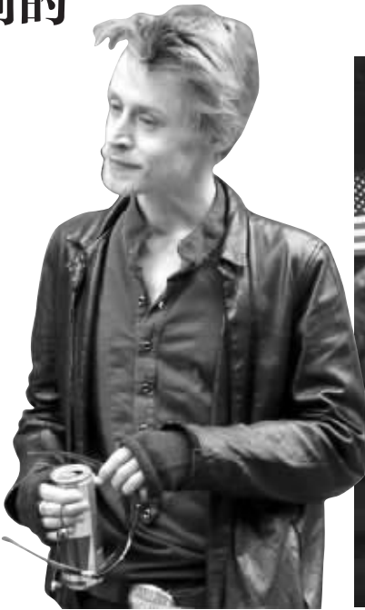
因吸毒暴瘦的麦考利·卡尔金

但这又是一个盛产各种儿童偶像的国度,从杰基·库根、秀兰·邓波儿,直到达科塔·范宁,都在为这一百年的娱乐历史做出贡献,并在长成之后,顺理成章成为巨星。巨大的名利前景下,尽管有“过气童星”这样一种以吸毒自残等等方式进行自毁的群落长期存在,提醒着过早催熟、过早脱离正常生