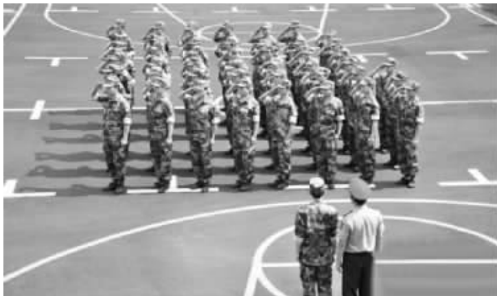
城管执法人员正在受训

8月1日,在中国人民解放军迎来第85个建军节的同时,汉阳区也迎来了一支特殊的国防后备力量——汉阳城管局武装部,这也是武汉市城管部门设立的首个武装部。首批40名城管工作人员加入民兵队伍,率先成为全市城管战线中的“特种兵”。