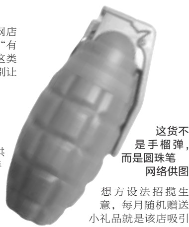
这货不是手榴弹,而是圆珠笔

记者根据“贼子蒙”提供的信息,联系上那家赠送“手榴弹”的网店。据该店客服人员表示,黄色“手榴弹”是一支圆珠笔,为该店的赠品。该店经常会随机送顾客一些赠品,一般每个月都会换花样。至于为何选择“手榴弹”,而且事先不告知有赠品,其表示可能是发货部门为了给客户一个惊喜。该客服人员坦言,如今网店越来越多,同质化竞争激烈,大家都在