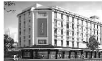
被改造的凤凰街西一大楼的效果图

近期,市容市政部门将对临顿路、凤凰街、桐泾北路、解放西路(唐胥桥至晋源桥段)4条道路实施街景立面整治工程。