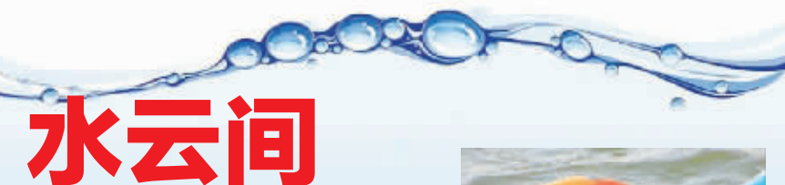
蓝天白云,与大厦的玻璃幕墙融为一体。7月30日摄于鼓楼 (作者凌丽获30元话费)