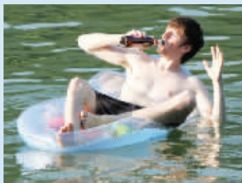
相比之下,还是留这发型容易救些。7月31日摄于花神湖 (作者宋丽霞获30元话费)