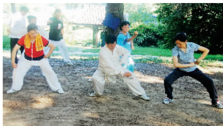
严重走样 师傅埋头示范,孰不知徒弟们各练各的,表情、动作千奇百怪。7月28日摄于玄武湖 (作者雨林获30元话费)

互动方式 投稿请注明拍摄时间、地点、作者姓名及手机号码 有啥好照片 发给快报瞅瞅 ■ 移动用户发送短信或彩信到 1065830096060 有啥好想法 说给快报听听 ■ 电信用户发送短信到 10659396060 支持原创图片,谢绝一稿多投 ■ 联通用户发送短信到 1065596060 ■ 你也可以直接投稿到信箱 dajiaxiu@126.com