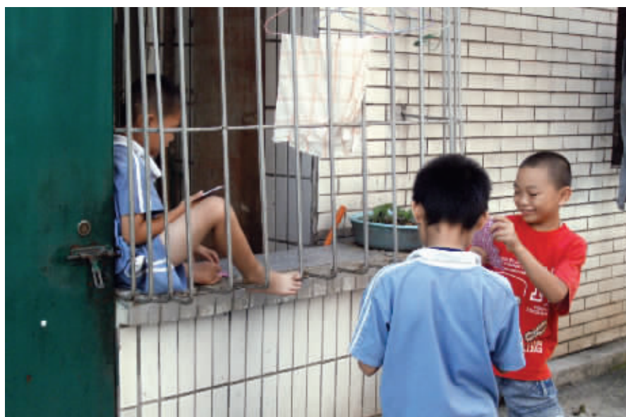
小男孩隔着铁栏与两个伙伴打牌,如此场景让我想起公益短片中那句话:关注孩子,不要关住孩子。8月1日摄于一小区 (作者朱先生获30元话费)