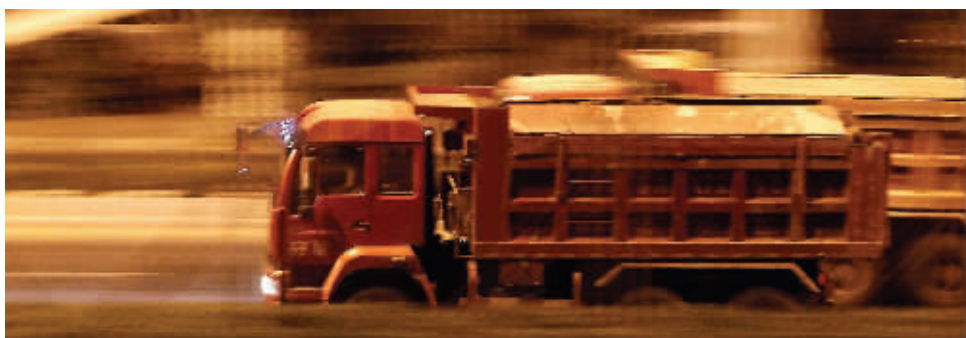
不少渣土车还是超速行驶

者区别，无非就是用途上的不同，渣土车专门拉渣土，工程车不能拉渣土，但可以拉其他建筑材料等。而南京“史上最严”渣土车新政中，并没有对工程车进行相关规定。因此有市民呼吁，工程车频繁出事，相关部门能否相应加强监管？