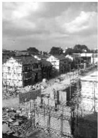
别墅项目现场