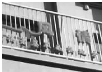
这个广告让人很费解

这段让人费解、不理解的广告语又是怎样出炉的,它又是怎样通过工商部门的审核?记者随后来到姜