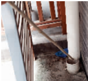
落水管因沉降而断裂