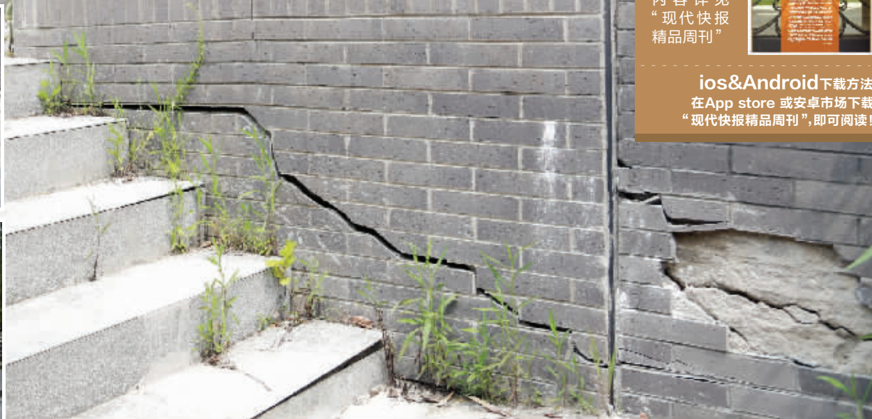
房屋沉降还在继续,触目惊心