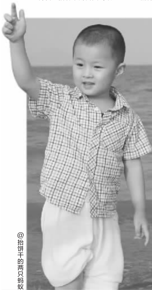
@拾饼干的两只蚂蚁

起宅家博主的强烈羡慕嫉妒。即将到来的8月是传统的“暑假季”,如果你也准备带着宝贝一起出门旅游,那么在给宝贝亲近自然,增加社交机会的同时,也多多发布微博晒照片吧。记得告诉我们你在哪里,让更多的网友一起分享你们“海角天涯任我行”的快乐旅行吧!