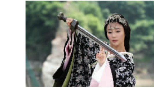
与虞姬有关的故事一直是影视剧的热门题材