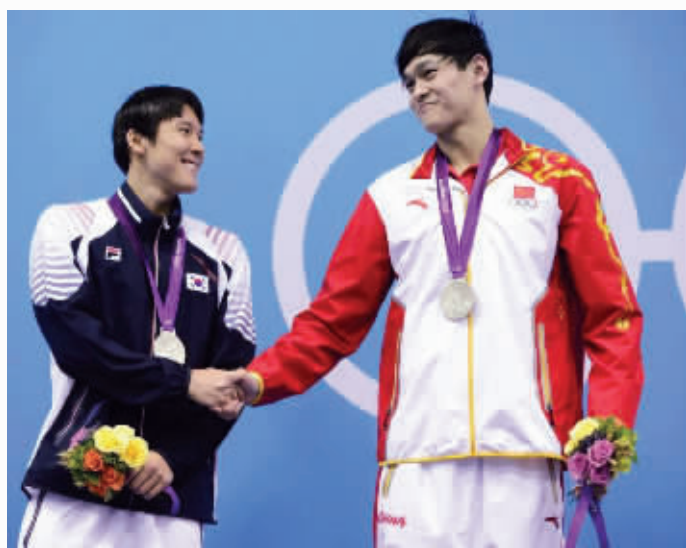
在颁奖仪式上,孙杨朴泰桓微笑握手