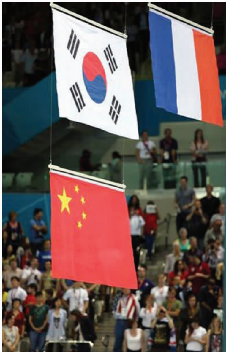
国旗如此挂法,引发争议