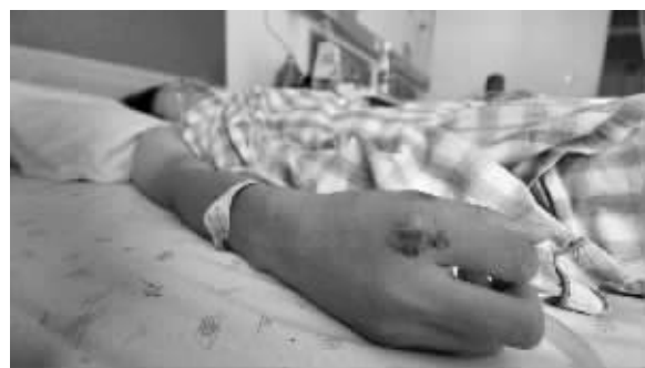
伤者韩某在医院