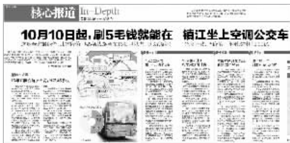
7月27日现代快报相关报道