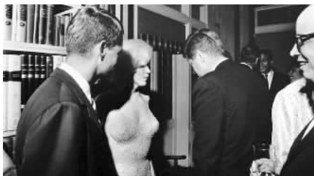
图为1962年,梦露和肯尼迪兄弟约翰·肯尼迪和罗伯特·肯尼迪(左)合影,当时她刚刚演唱了《总统先生,生日快乐》

据美国媒体、英国《每日镜报》7月29日报道,距美国性感女神玛丽莲·梦露去世50周年纪念日即将到来之际,梦露生前的时装设计师之子、现年74岁的达文·波特在新书《彩虹尽头的玛丽莲:性爱、谎言、谋杀和大掩盖》中,石破天惊地披露了玛丽莲·梦露的死亡真相:梦露死前曾向朋友透露她已怀上身孕,但连她自己也不清楚腹中胎儿的父亲到底是美国总统约翰·肯尼迪还是肯尼迪的司法部长弟弟罗伯特·肯尼迪。波特在新书中宣称,梦露其实是被5个黑手党“职业杀手”用氰仿毛巾谋杀的,但幕后雇凶灭口的“真凶”很可能就是梦露的前情人、美国司法部长罗伯特·肯尼迪!