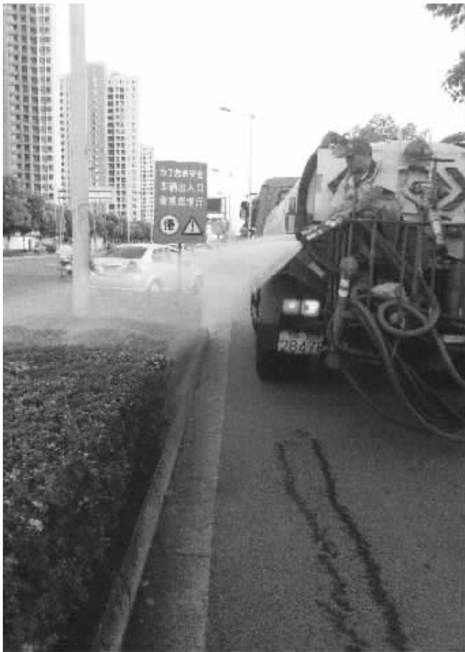
工人忙着浇灌绿化