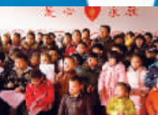
快乐暑期卖报活动