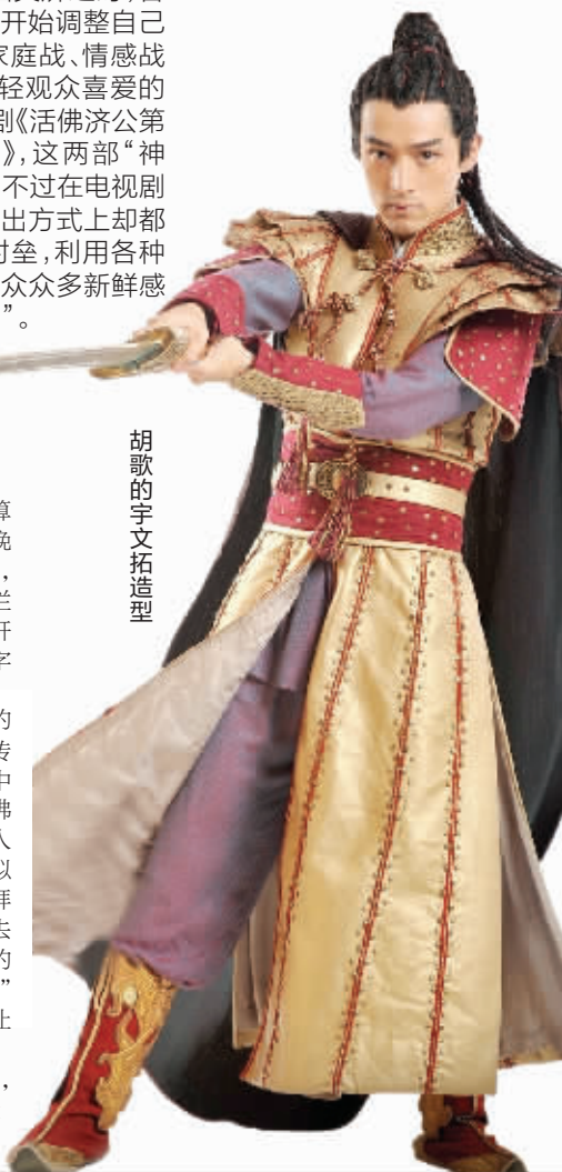
胡歌的宇文拓造型