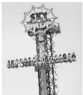
想体验“云端漫步”吗

环球缤纷嘉年华在7月20日已经开始试营业,哪些项目最受欢迎?工作人员介绍,旋转木马、“云端漫步”“长江之眼”是最受市民喜欢的游乐项目。“云端漫步”是一种可以从底部上升到50米高度的旋转骑乘设备,是此次活动的一大亮点,南京其他游乐场都没有。“长江之眼”就是摩天轮,白天坐上去可以欣赏江景,夜晚则可以俯瞰园区绚丽的夜景。主办方还将在不同的时间段,制造一些“欢乐引爆点”,如摇滚音乐节、七夕鸡尾酒派对、萤火虫之夜、幸福摩天轮集体婚礼、江滩之夜