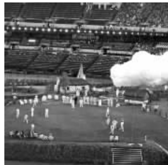
开幕式彩排现场展现田园风格