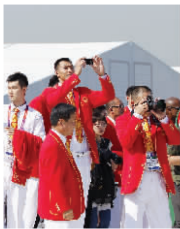
男篮队员拍摄演员表演

升旗仪式后,音乐再次响起,会场变为欢乐的海洋,演员们再次跳起欢乐的舞蹈,一边跳一边引领着运动员们离开会场。“都说亚洲人很羞涩,可是中国人很投入,他们还和我们跳舞呢!”女演员哈勒维兴奋地说。