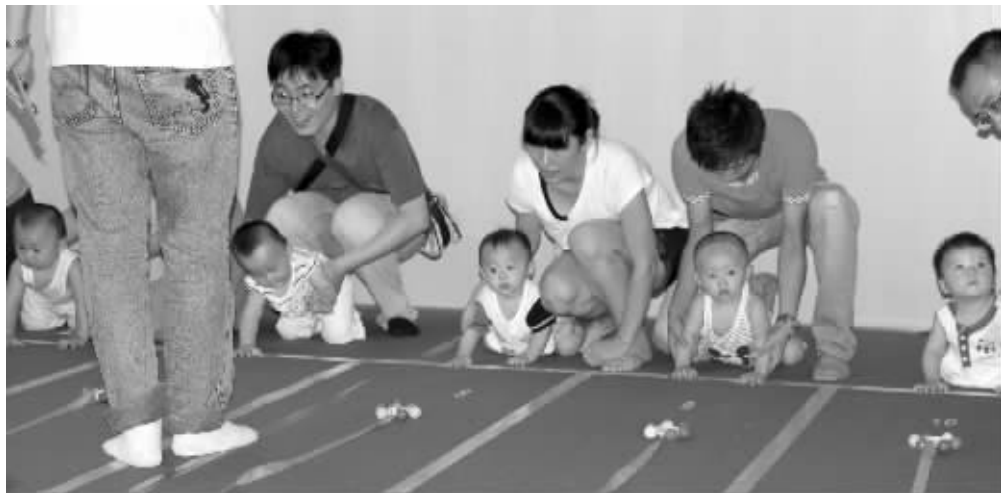
比赛现场宝宝整装待发

7月22日下午,在虹桥新城市上演了一场精彩的宝宝爬行比赛。本次比赛由成长点点周刊和东方爱婴早教中心联合主办,现场共有100多名7-18个月的宝宝参与,200多名家长齐声为小宝宝们欢呼鼓舞,火爆的场面吸引了商场所有顾客的围观。