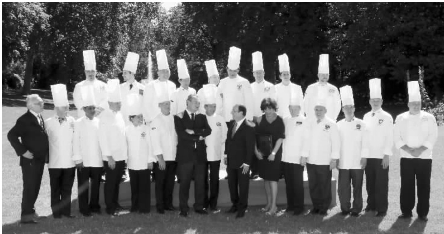
当地时间7月24日,各国顶级大厨齐聚法国巴黎爱丽舍宫