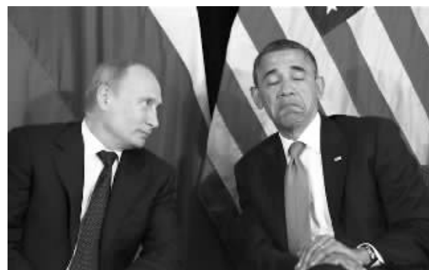
俄罗斯总统普京和美国总统奥巴马在一起