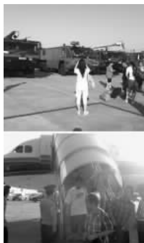
乘客“猫小婧婧”的微博图片