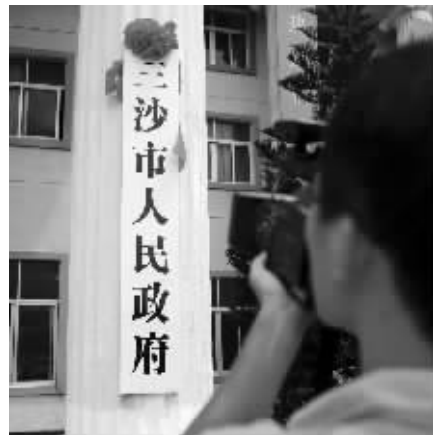
7月24日,一名记者在拍摄刚揭牌的三沙市人民政府牌匾