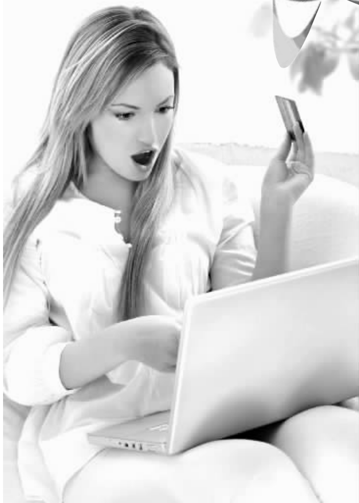
大乐透头奖井喷,彩民大呼过瘾