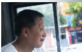
公交司机老高顶着高温开车