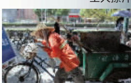
环卫工戴草帽干活

从昨天早晨开始,南京气温飙升,站在室外,热浪烘烤得人们汗流浹背。临近中午,最高温度已经达到36℃。