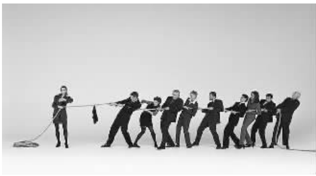
职场女强人越来越多(资料图片)