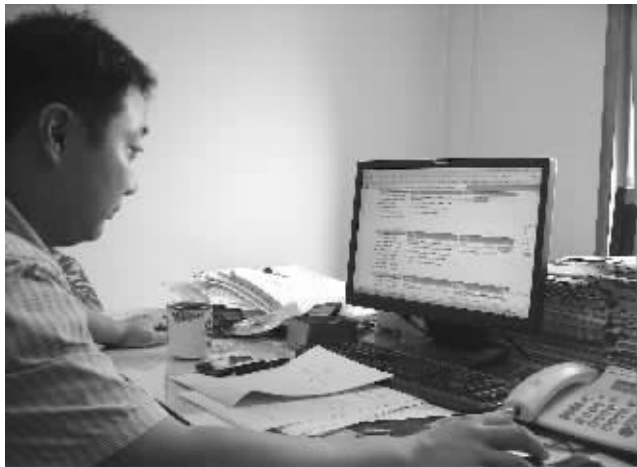
丹徒区干部财产申报有望年底在网上公示

近日,淮安市纪委、市委组织部出台了《关于同步公示拟提拔干部财产的暂行办法》,今年8月1日起,淮安将对市、县两级拟提拔乡(科)级以上干部全部实行财产申报公示。由于近几年来民间对建立官员财产公示制度的呼声日益高涨,因此此举在社会上引起巨大反响。事实上,对官员财产申报公示的探索,淮安并非先例,近年来,江苏省内外有多个地区尝试建立领导干部财产申报制度。其中,早在2007年,镇江市丹徒区就启动了后备干部个人及家庭财产申报工作。5年以来,丹徒区已有251名干部通过申报被提拔,占全区现职乡(科)级以上干部44.1%。