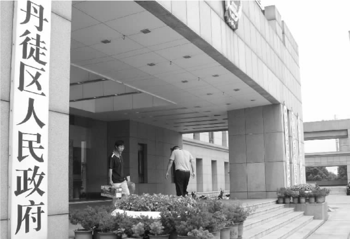
干部财产申报在镇江丹徒区已经实践了5年

知,干部申报的财产只在干部所在单位上墙公示,跟干部任前公示同期,公示有举报电话,暂时没有上网,外人无法通过网络看到公示。