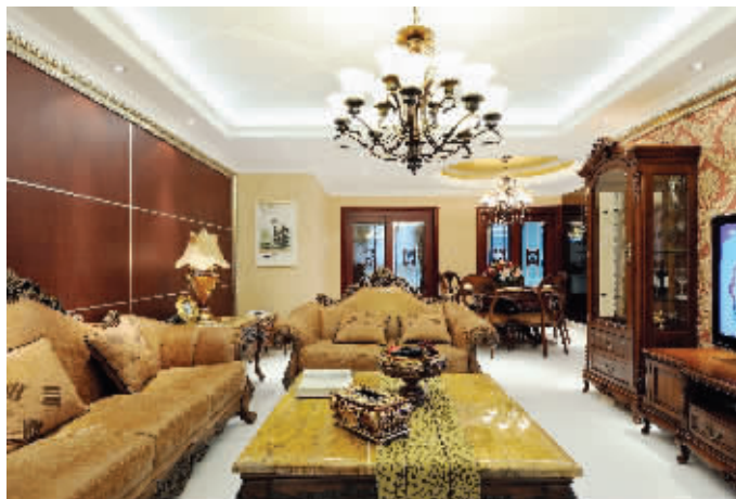
面对面装饰设计图

“针对业主家装过程中出现的问题, 我们保证在12小时内, 让相关责任人与业主取得联系, 落实问题并确定解决方案。在相关问题责