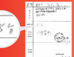
复试成绩单显示,路某的面试成绩为65分