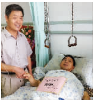
盐城市见义勇为基金会送上5000元奖金