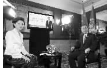
潘基文(右)和中国网友在线对话

17日晚,甫抵北京的联合国秘书长潘基文便在下榻酒店,通过新浪微博与中国网友进行在线对话,畅谈天下事。在线对话于当晚7时30分许开始,由联合国儿童基金会中国大使、著名主持人杨澜主持。在将近一小时的对话过程中,潘基文共回答了来自北京、上海、四川、辽宁等地网友提出的9个问题。据统计,对话活动期间,共有超过15000名网友参与提问。