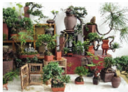
董政制作的微型盆景

两年前,董政在上海古玩市场看见有紫砂小花盆出售,每个都不足鸡蛋大,模样古朴可爱,他买了好几个。“如果在这些花盆里种上植物,就是有生命的艺术品了。这不就是我一直寻找的吗?”不过,董政在制作微型盆景的过程中,不满足于使用市场上现成的小花盆,“我想自己的每一个盆景都与众不同。”于是,去年他特地到宜兴购买了优质的紫砂土,还从网上淘来制作微型陶器的工具。工作之余,董政就在家玩起了“泥巴”:设计好花盆的样子;用紫砂土先捏出花盆大