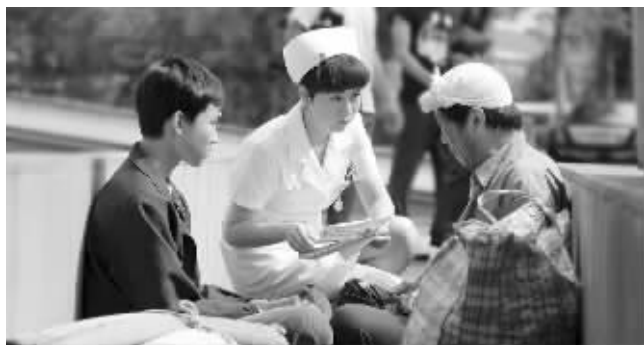
相信看过《心术》的人,都会对无钱治病的这对父子印象深刻。电视剧里,是“美小护”收下了病重的孩子 资料图