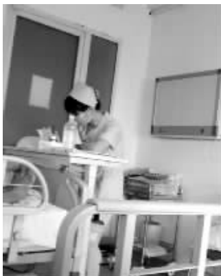
医院里照顾小满的护士