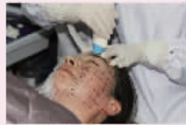
本院目前正在推广美国塑美极三代 CPT技术治疗