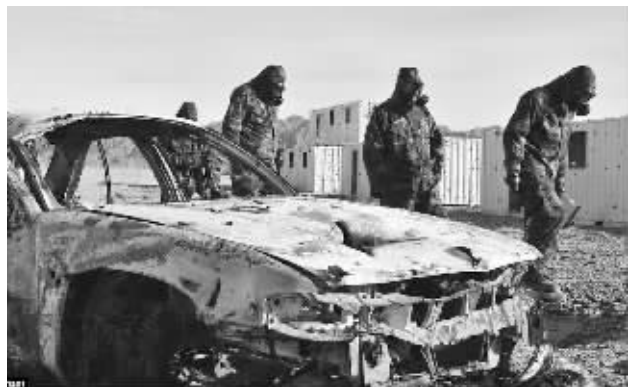
一队FBI学员在“幽灵镇”里进行地面训练

尔镇在一次模拟空袭中遭炮弹洗礼的惨烈场景:“大炮和迫击炮轮番开火,(地面部队)冲向目标复合体,而各种飞行器(无人机)在山顶学员的严密控制下,一架接着一架地轮番起飞轰炸。整个小镇地动山摇,仿佛再也难以站稳。过了一会儿,眼前的‘敌方阵地’上空突然被滚滚浓烟和灰尘遮天蔽日,目标再也无法看得清楚。而这正是这些学员们将来在真实战场中所必须解决的难题。”