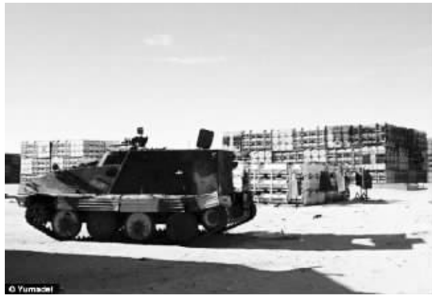
用集装箱堆砌出来的“建筑”,街上有装甲车等车辆