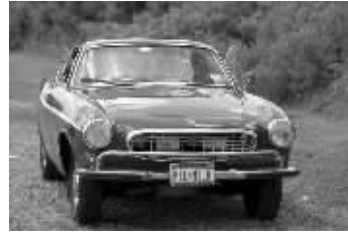
这辆小车至今仍由原厂发动机驱动

据新华社电 美国一名七旬老翁驾驶钟爱的沃尔沃1966年款P1800S型跑车,历时多年,足迹遍布美国各州和国外一些地方,总行程里数即将达到300万英里(482.8万公里)。