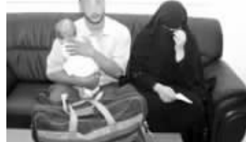
这对夫妇竟将婴儿放包里偷带入境

据英国《每日邮报》9日报道,本月6日在阿联酋的沙迦国际机场发生了惊人的一幕:一对埃及夫妇企图将他们5个月大的孩子装在包里,通过安检偷带进阿联酋境内,被机场的安检人员抓了个正着。