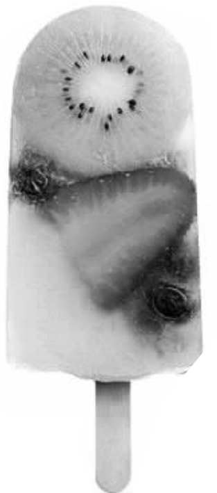
鲜果棒冰真的有水果