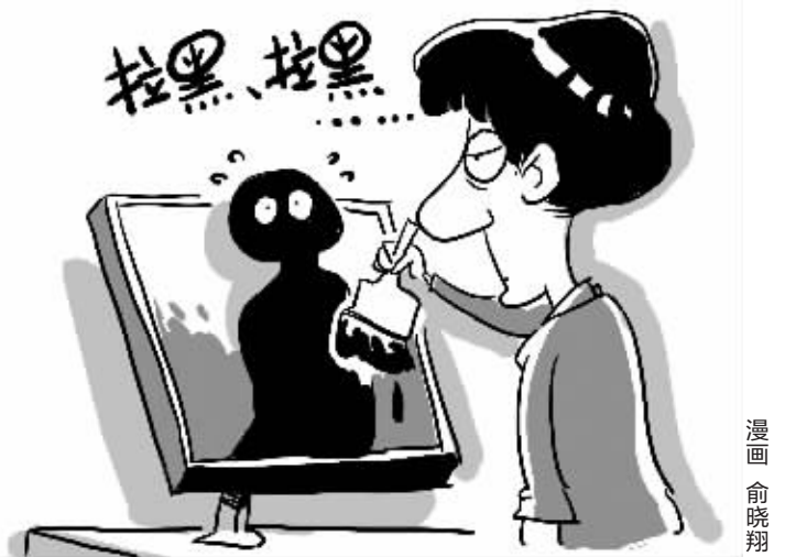
漫画 / 俞晓翔