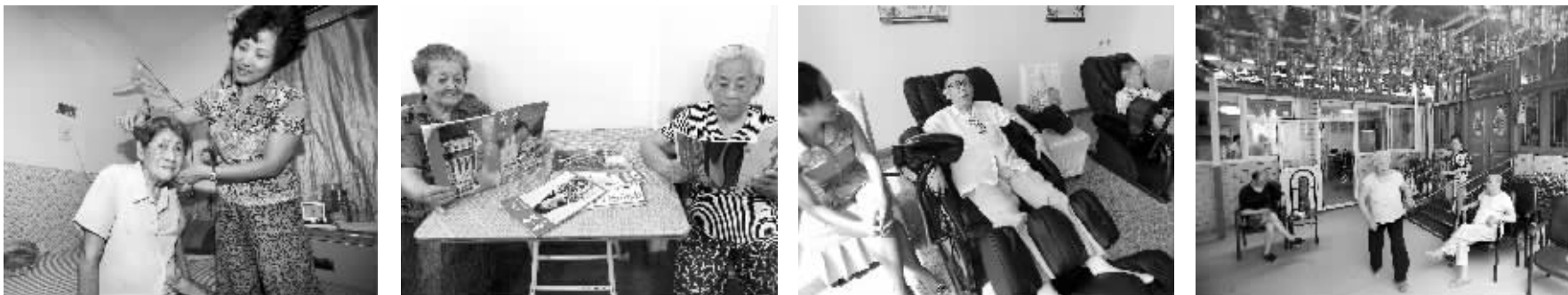
到老年公寓养老已经成为越来越多南京人的选择