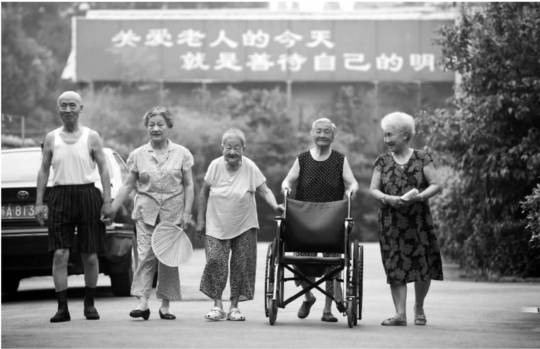
7月7日,鸿福老年公寓里的老人们晚饭后在院中散步

郑清: 养老问题是一个庞大的社会工程,仅仅依靠政府的财力支持,是难以解决的。政府需要在制度、法规、政策诸方面予以有力的引导和推动,提供良好的市场环境,依靠市场经济的自然调节功