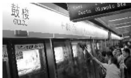
保洁员正在擦拭安全门上留下的灭火器粉末

昨天下午4点50分左右,正值下班晚高峰,地铁一号线鼓楼站,一趟从迈皋桥开往中国药科大学方向的列车刚进站,靠近列车尾部的地方发出了一声“嘭”的爆响声,随即冒出火星。地铁方面紧急疏散了车上乘客,并做了应急处理。受此事故影响,地铁一号线列车出现了短时间的减速、到站停留时间长等情况。据地铁方面称,事故原因是受电弓突然打火,从发生故障到列车驶离约5分钟时间,地铁运营未受大影响。