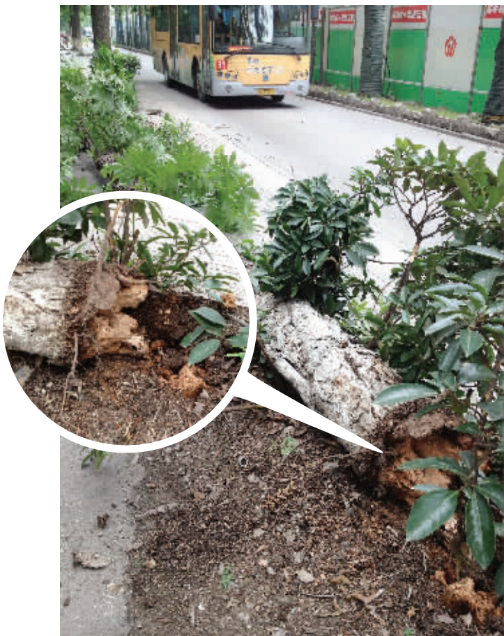
昨天中午又有一棵树倒下, 根部已经被泡烂了