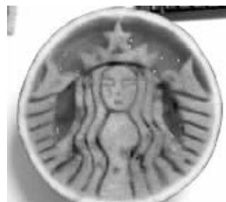
@新潮流MILK: 今天的西瓜口味真洋气呢~ 给大家败败火~

@新闻晨报: [我彻底膜拜了, 这算是超豪华配置啊!] 今天, 网友@御用小树在上海昌化路看到雷人一幕, 你舒服……我佩服! 我们只能道声: 佩服, 佩服!