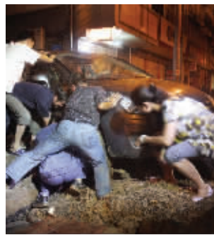
众人将车抬出