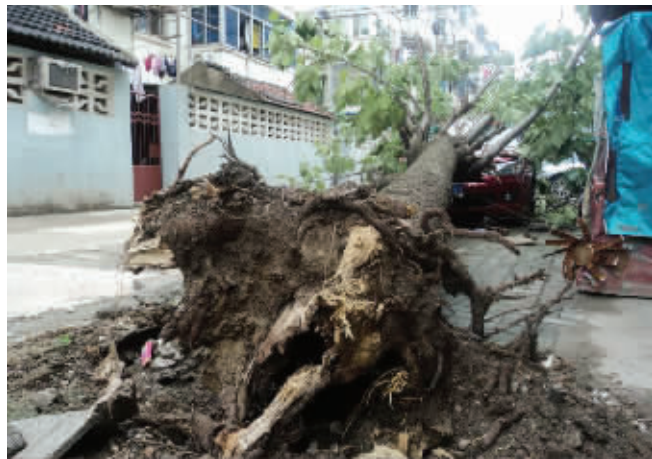
大树根小区一辆轿车遭当头一棒 报料人供图

快报讯(实习生 赵凤娟 记者 李绍富 顾元森)“合抱粗的杨树倒下来,砸坏了轿车,幸亏没有砸到人。”昨天上午,龙蟠路曙光大酒店的保安看着路边倒下的5棵大树,感到很庆幸。7月3日晚上6点左右,在狂风暴雨中,酒店门口附近的5棵杨树倒下来,砸中了3辆轿车,此外玄武区大树根小区也有一辆车被大树砸坏。