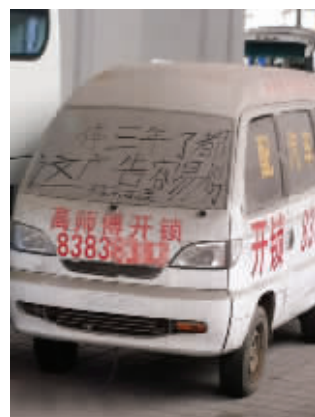
成功,在于不懈坚持