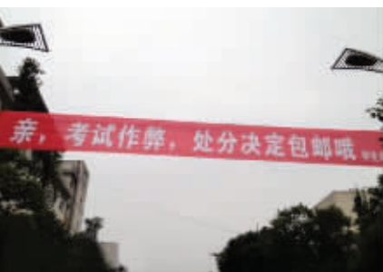
而且你不敢给差评哦,亲