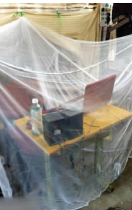
给你全方位的保护