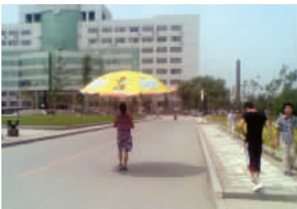
我的伞下不再有你