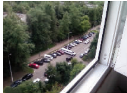
按规矩停车也有错吗?