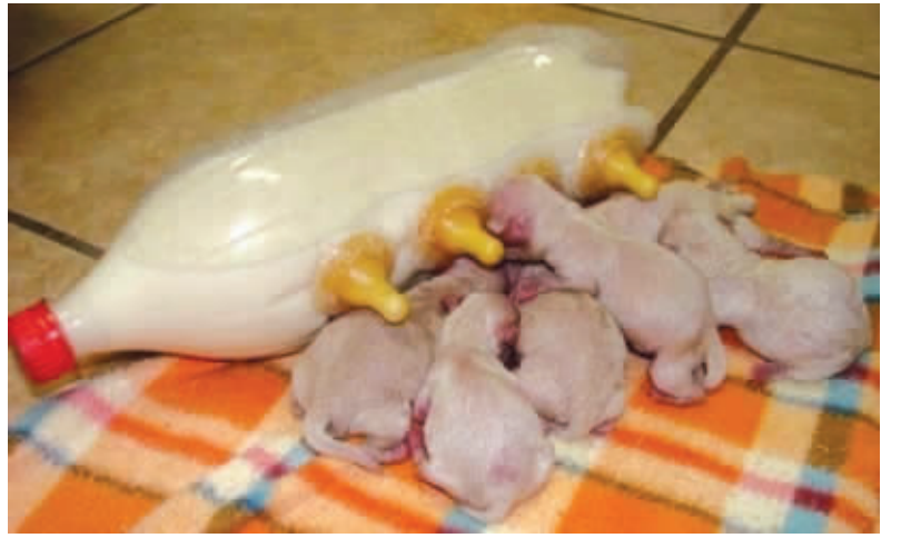
正所谓“有奶便是娘”