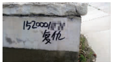
看来办证生意不太好做啊