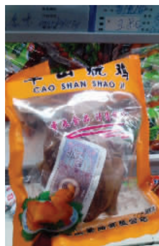
史上最狠的促销手段