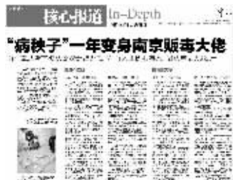
快报3月31日相关报道

毒枭扯谎自称马仔 昔日手下“卖”了他 快报报道过的南京毒老大已被批捕,即将接受审判