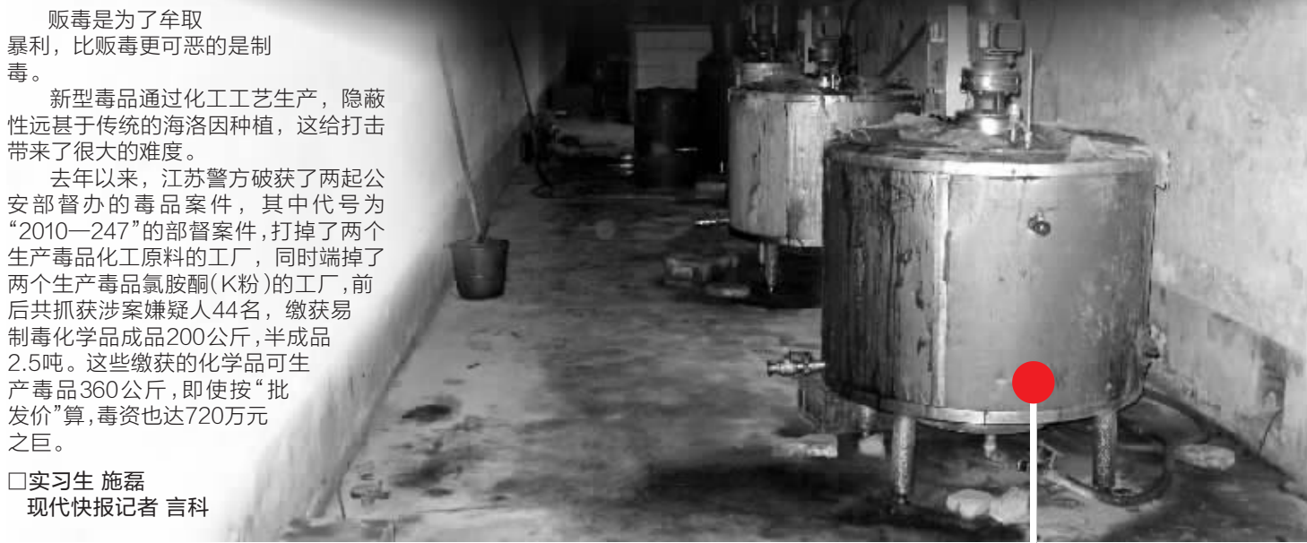
“苏北二厂”里用来生产K粉原料的反应釜