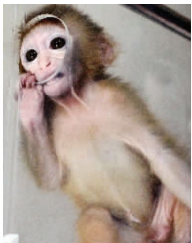
爸爸走了,“悟空”爬到育幼箱边张望