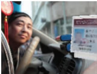
南京成说,他名字的含义是要在南京获得成功

【欢迎“荐名”】姓名背后,是一段精彩的人生故事。您的身边,还有哪些有趣的名字,欢迎通过微博告诉我们。上新浪微博,加标签#趣名推荐#,@现代快报。